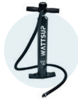
Pompe de gonflage