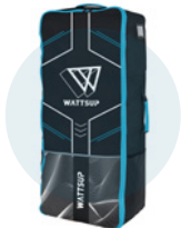
Sac de transport