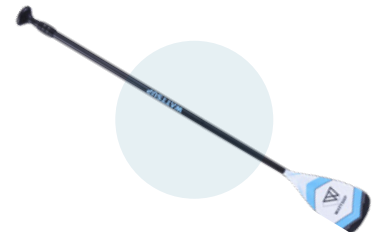
Pagaie 3 sections