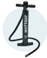
Pompe de gonflage