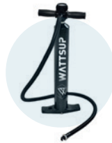
Pompe de gonflage