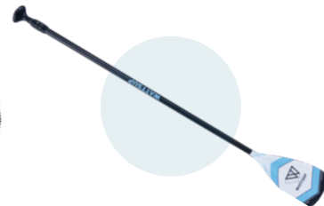
Pagaie 3 sections