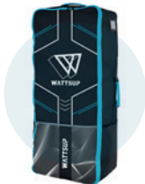
Sac de transport