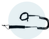
Leash de sécurité