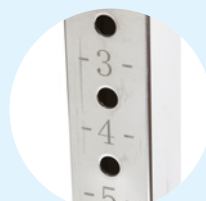
Réglages gradués précis