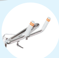
Guidon Sport 45°