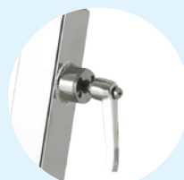
Réglages rapides Click & Turn