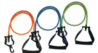
ÉLASTIQUES 3 RÉSISTANCES AU CHOIX