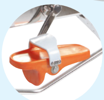
Confort pieds nus