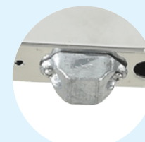
Anode sacrificielle pour usage marin