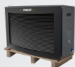
Se entrega en palé de madera

La Jetline Premium Fi conserva no obstante todas las ventajas que le han dado su éxito: su funcionamiento reversible le permite funcionar a partir de -15 °C, su desescarche automático y su intercambiador Twisted Tech de titanio garantizado por 15 años. Convencido por la excelencia de sus productos, Poolex amplía la garantía de la Jetline Premium Fi a 3 años,