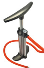
Pompe bravo 100