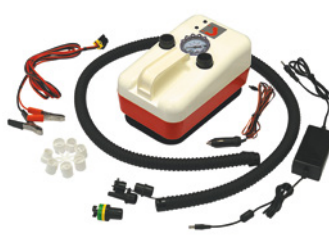
Pompe bravo 20