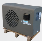
Livraison sur palette bois