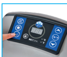
Bloc moteur intelligent Fonction de régulation automatique de la température.