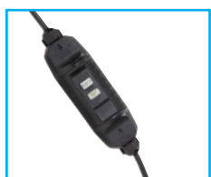
Prise de sécurité 10 mA 100% sécurisée contre les risques électriques. Intègre un disjoncteur différentiel 10 mA.